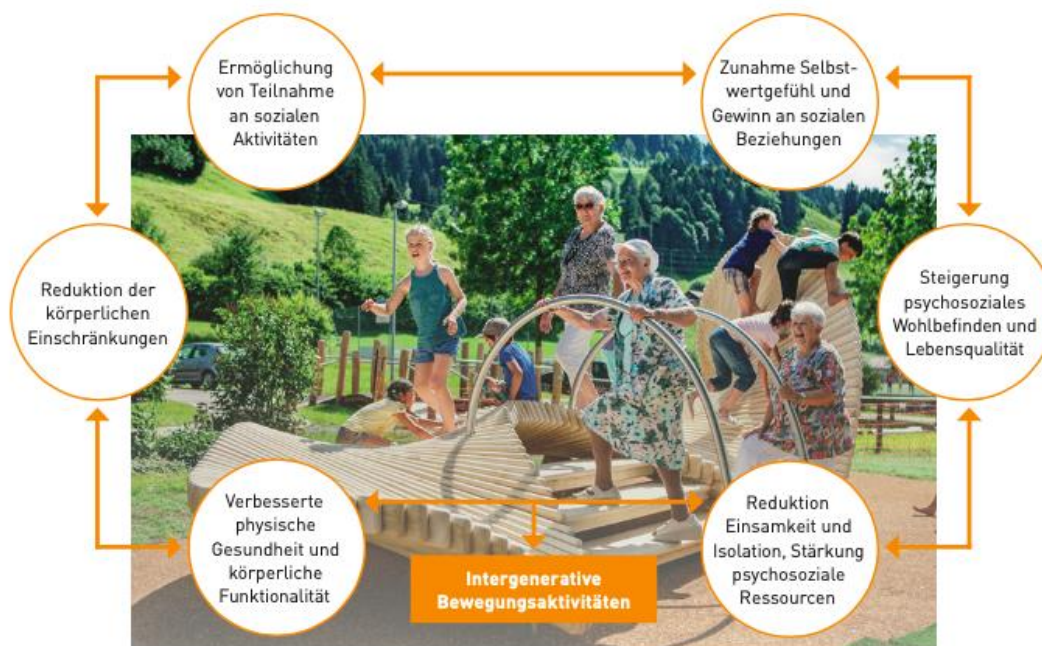
Wirkungskreis der intergenerativen Bewegungsangebote zur Förderung sozialer Teilhabe bei älteren Menschen [2]